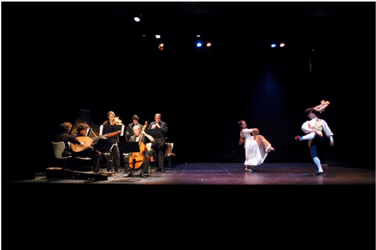
ENSEMBLE DIATESSARON, Instrumentos Antiguos